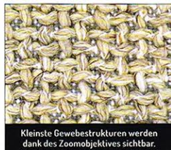
Kleinste Gewebestrukturen werden dank des Zoomobjektives sichtbar.

sante Ledermuster. Mit einem Karton voller Materialien kann das Scannen beginnen.