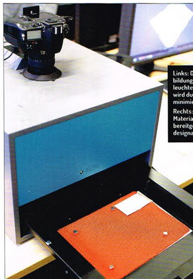
Links: Die Faltenbildung der hinterleuchteten Probe wird durch Magnete minimiert. Rechts: Ausgewählte Materialproben, bereitgestellt von designaffairs