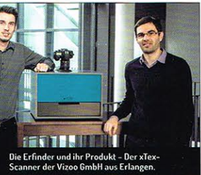
Die Erfinder und ihr Produkt – Der xTex-Scanner der Vizoo GmbH aus Erlangen.

Nando Nkrumah arbeitet freiberuflich im Bereich CGI in Köln und veröffentlicht regelmäßig Beiträge zum Thema 3D-Modeling und Rendering. Mehr Information unter www.lichtblickstudio.com .